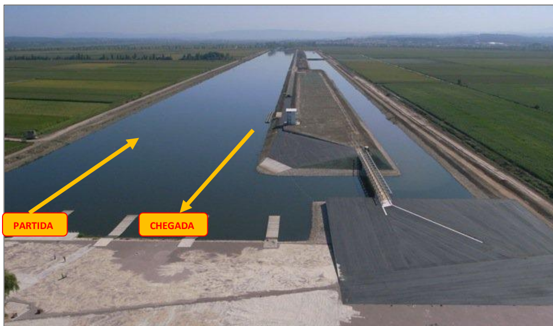
Imagem.2 – Zonas de Partida e Chegada